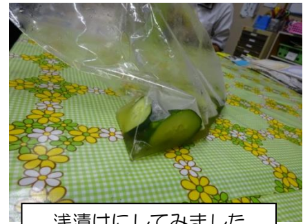
浅漬けにしてみました