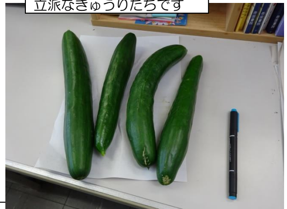
立派なきゅうりたちです