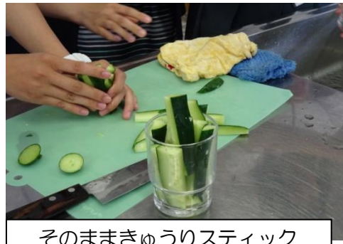
そのままきゅうりスティック